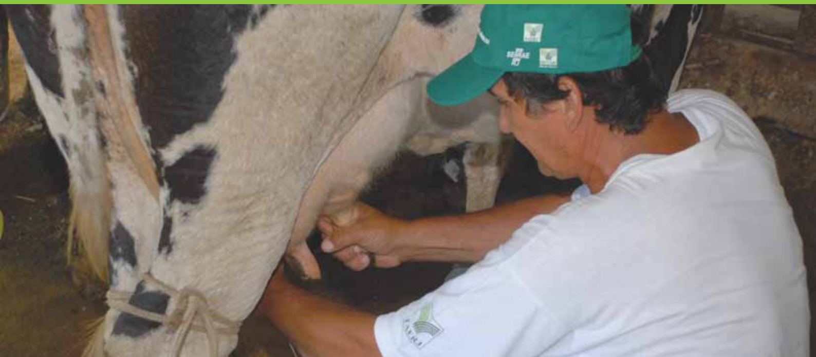
Tabela 24 Entidade que promove mais frequentemente programas de capacitação, segundo estratos de produção, em 2009